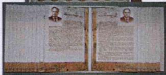
Научно-археологические фонды, архив, библиотека