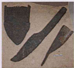
Сельскохозяйственные орудия из округа Минска