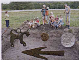
Селище в Гольшанах 2008 г.