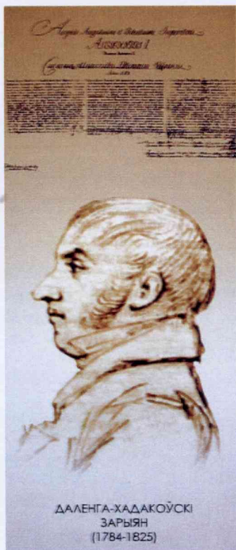
ДАЛЕНГА-ХАДАКОЎСКИ ЗАРЫЯН (1784-1825)