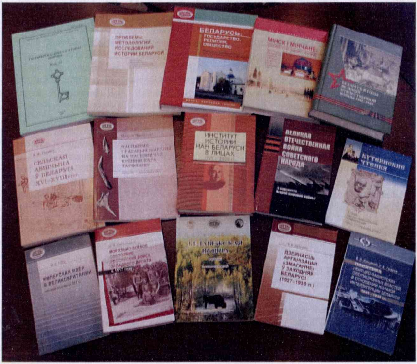
Калекцыя кніг Інстытута гісторыі Нацыянальнай акадэміі навук Беларусі