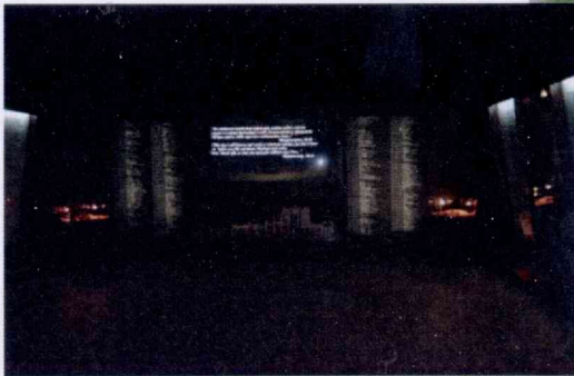
Музей яўрэйскага супраціўлення (вул. Мінская, 64)

(звяртацца ў гістарычна-краязнаўчы музей, тэл. (+375 1597) 2-14-70)