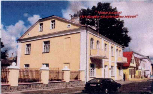
Навагрудскі гістарычна- краязнаўчы музей (вул. Гродзенская, 2)