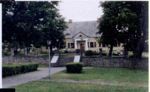
Дом-музей Адама Міцкевіча (вул. Леніна, 1)