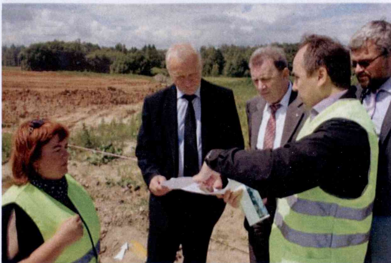
Старшыня Прэзідыума НАН Беларусі акадэмік У.Р. Гусакоў знаёміцца з ходам археалагічных даследаванняў у зоне будаўніцтва другой кальцавой аўтадарогі вакол г. Мінска