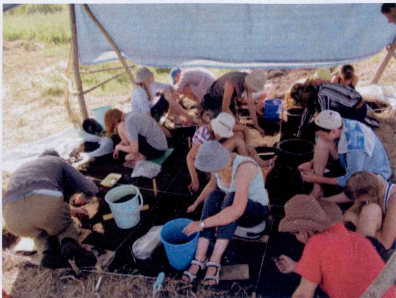
Паселішча Асавец 4 Бешанковіцкага р-на. Крывінскі тарфянік. Раскопкі Макс.М. Чарняўскага