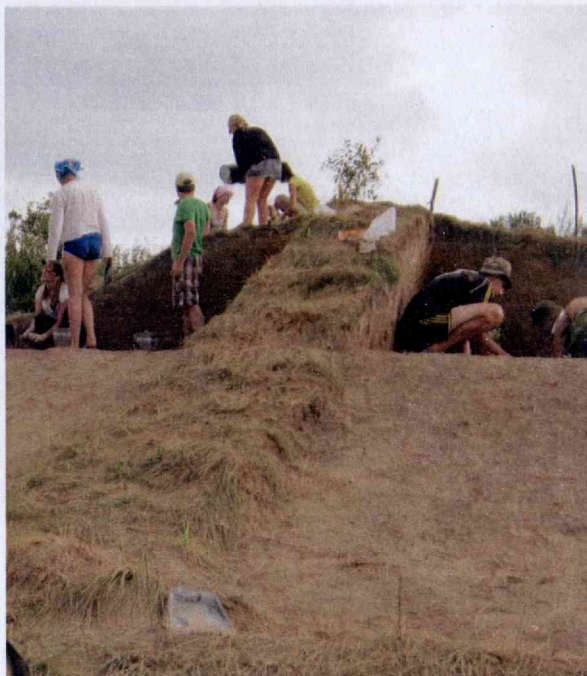
Гарадок. Курган № 2. Раскопки В.М. Ляўко