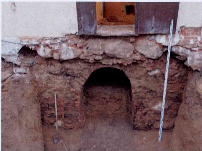
Мінск. Вул. Ракаўская, 14. Выратавальныя работы В.І. Кошмана