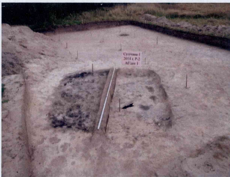
Селішча Сулічава Драгічынскі р-на. Рэшткі жылой пабудовы жалезнага веку. Раскопкі А.Ф. Касюк