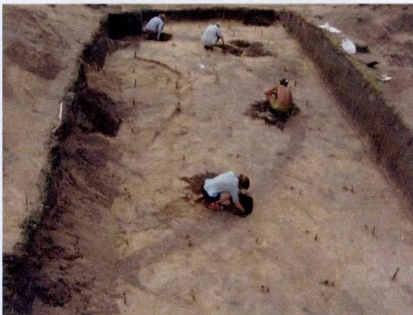
Курганны могільнік сярэдняпроўскай культуры каля в. Копань Рэчыцкага р-на. Раскопкі М.М. Крывальцэвіча