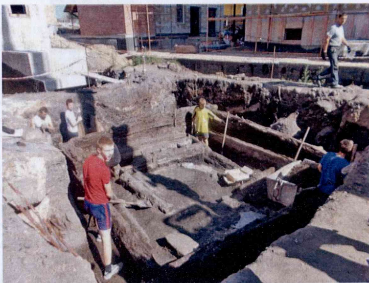
Навагрудак. Вул. Замкавая. Выратавальныя раскопкі І.У. Ганецкай