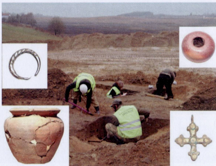
Селішча Х–ХІІ ст. Васілеўшчына (Дзяржынскі раён). Выратавальныя даследаванні пад кіраўніцтвам А.В. Вайцяховіча, В.Л. Лакізы. ТОП-10 вынікаў дзейнасці вучоных НАН Беларусі