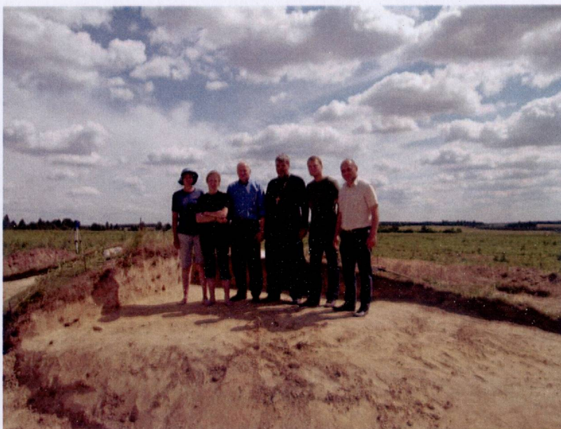
Старшыня Прэзідыума НАН Беларусі акадэмік У.Р. Гусакоў знаёміцца з ходам археалагічных даследаванняў курганага могільніка паміж вёскамі Курганне і Бацвінава Гомельскай вобласці. Раскопкі Г.Р. Цімафеенка