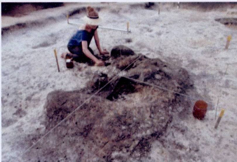
Славянскае селішча Барыскавічы-1 (V–X стст.). Мазырскі раён. Даследаванне рэшткаў жылой пабудовы. Раскопкі А.Ф. Касюк