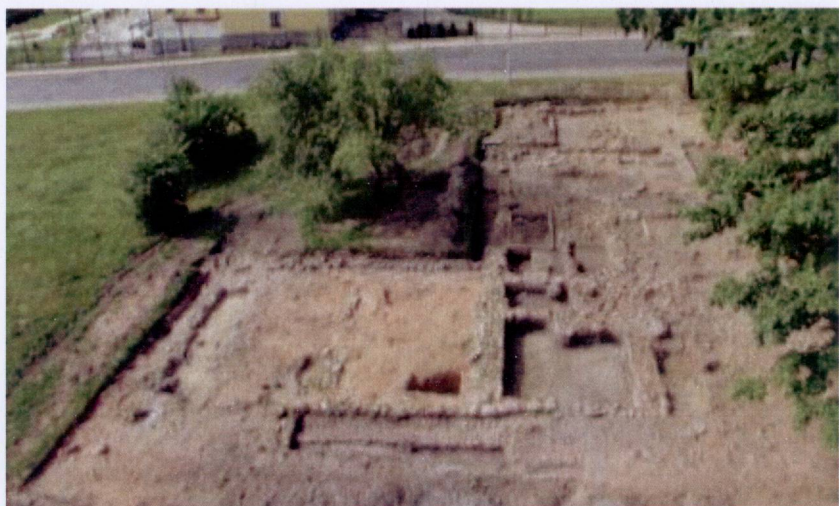
Паўночны флігэль сядзібы Ваньковічаў (XVIII–XIX стст.). Мінск, вул. Філімонава, 24. Навуковы кіраўнік В.І. Кошман