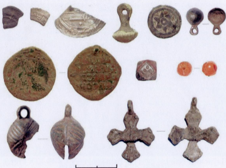
Знаходкі з археалагічнага комплексу Кардон. Даследаванні В.М. Ляўко, П.М. Кенька