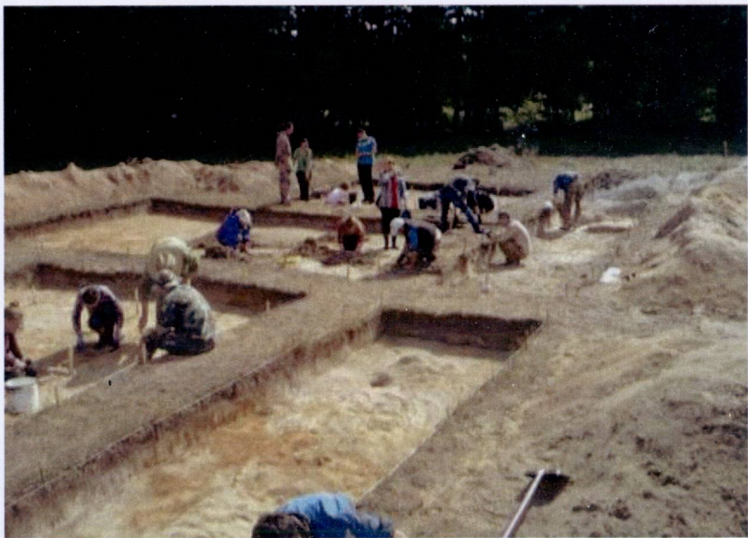
Археалагічныя даследаванні на тэрыторыі НП «Белавежская Пушча». Раскопкі А.Ю. Ткачова