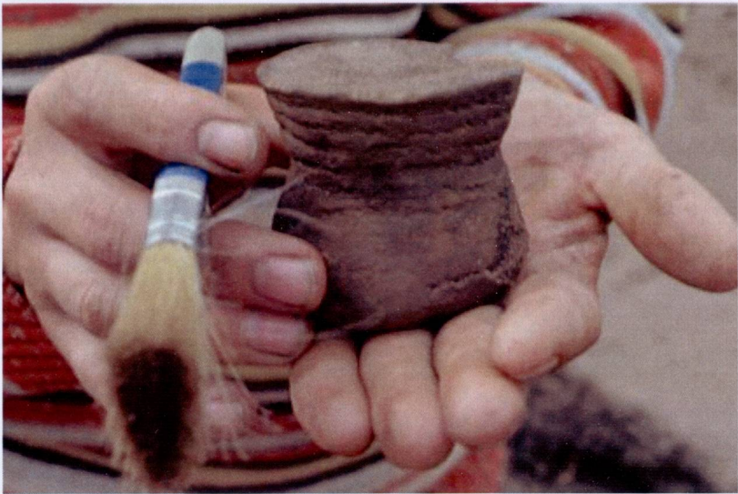
Посуд з курганнага могільніка сярэдняпроўскай культуры каля в. Копань Рэчыцкага р-на. Раскопкі М.М. Крывальцэвіча