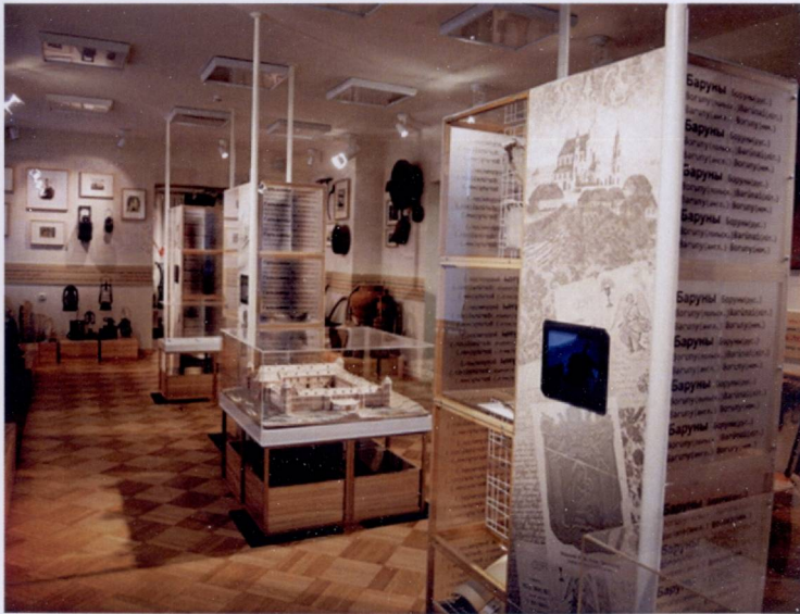
Запрашаем наведаць Ашмянскі краязнаўчы музей імя Ф.К. Багушэвіча г. Ашмяны, вул. Савецкая, 128. Тэл. +375 15 9342593