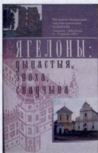
I Гальшанскіх чытанняў