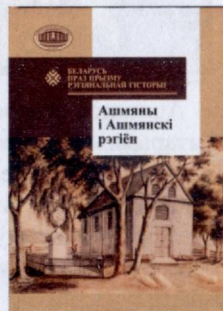
V і VI Гальшанскіх чытанняў