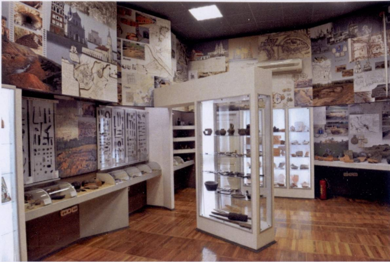
Запрашаем наведаць археалагічную навукова-музейную экспазіцыю Інстытута гісторыі Нацыянальнай акадэміі навук Беларусі г. Мінск, вул. Акадэмічная, 1. Тэл. +375 17 2841870