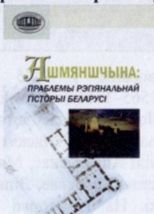
II – IV Гальшанскіх чытанняў