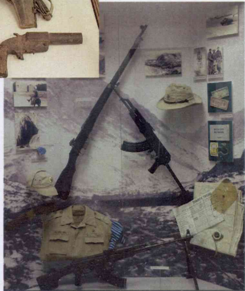
Фрагменты стационарной военно-исторической экспозиции Гомельского областного музея военной славы