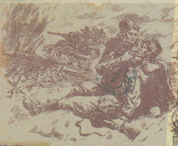
Смерть немцам оккупантам!