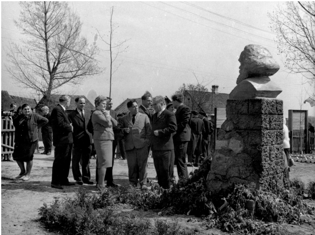
Выездное заседание ученого совета Института истории. Май 1968 г.

Несмотря на огромную занятость, она не оставляла и научную работу. В это время была подготовлена монография «Белорусский народ в борьбе за советскую власть» 11 . Она участвовала в подготовке и издании крупных обобщающих работ «Историография социалистического и коммунистического строительства в СССР» (Москва, 1962), «Октябрь и Гражданская война в СССР» (Москва, 1966), «История СССР» (Москва, 1967, т. VII), «История национально-государственного строительства в СССР» (Москва, 1968). При ее участии была подготовлена работа «Победа советской власти в Белоруссии» 12 и новое издание истории Минска, посвященное 900-летию города 13 .