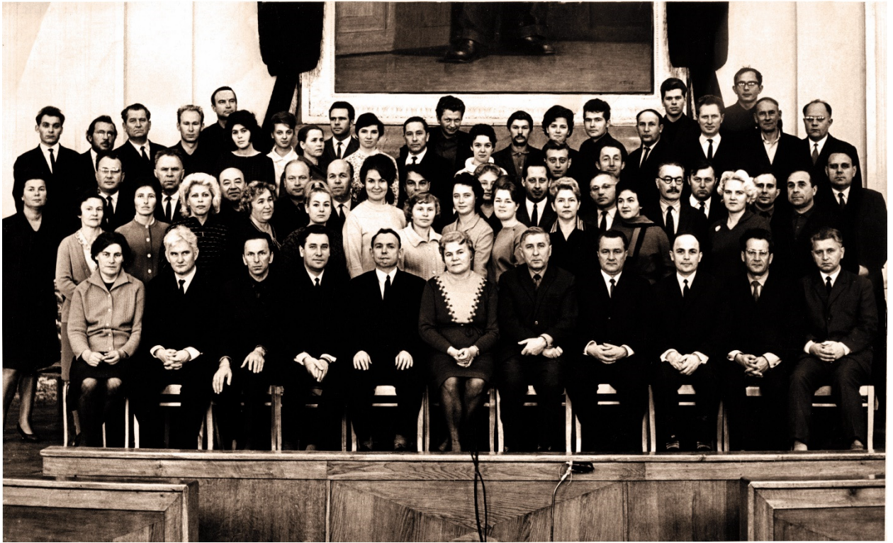
Коллектив Института истории АН БССР. 1967 г.