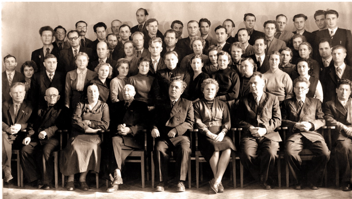
Коллектив Института истории АН БССР. 1958 г.